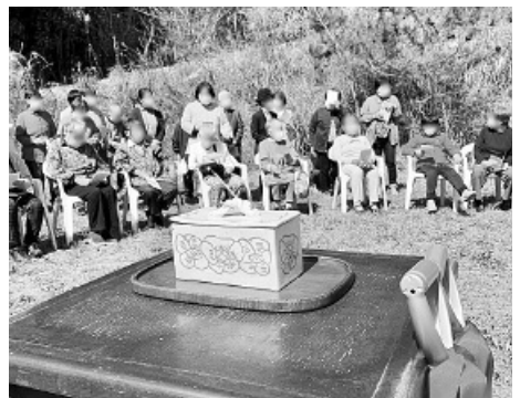
陶器の器に、「新棟の礎となる聖句」と参列者全員の名前を書いた巻紙を入れて大地に埋めました。