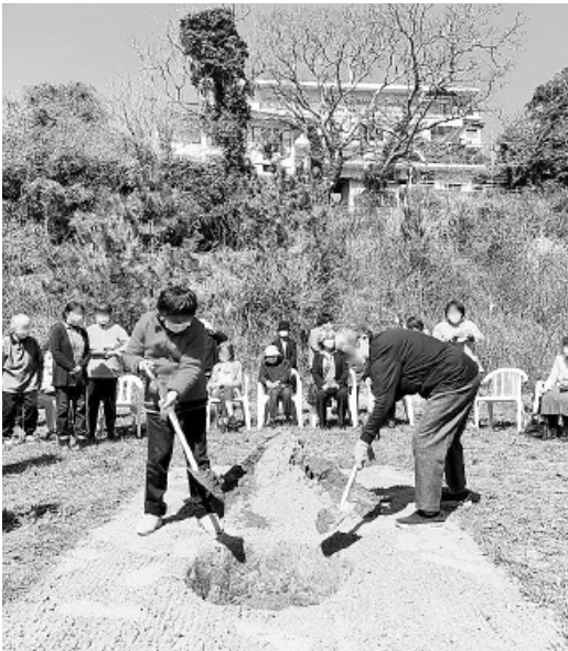
参列者全員で砂かけ

利用者、職員、法人理事、 協力団体や地域の方々、建 設に関わる業者や設計の 方々などにお集まりいた だき、みんなで工事の安全 と無事に建物が完成する ようにお祈りしました。